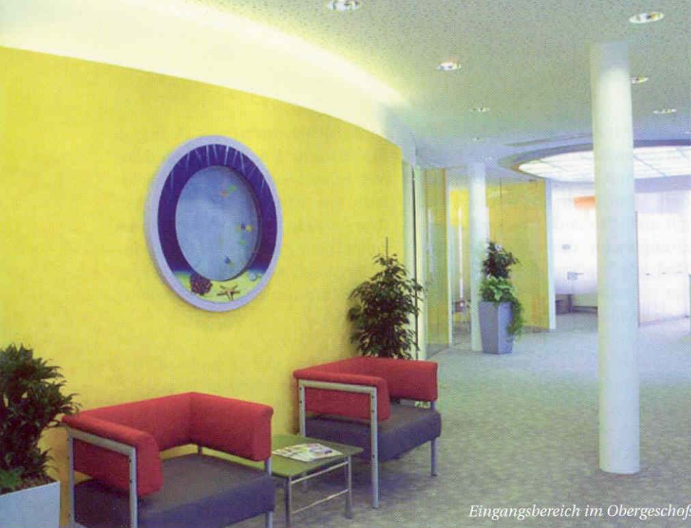
Eingangsbereich im Obergeschoß

strömt und alle Zellen miteinander verbindet. Wir kennen das aus der Akupunktur: Blockaden werden aufgelöst und der Qi-Fluss wieder ins Gleichgewicht gebracht. Ähnliches tut Feng Shui bei Gebäuden und Räumen: Gestaltung und Einrichtung werden untersucht und, wenn nötig, verändert, um den Qi- und Energiefluss zu verbessern.