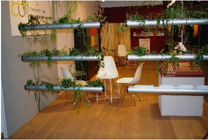
Schöne Begrünung mit Pendularis von Firma Creaplant

Hinzu kommen nochmals 71 Zuhörer aus den beiden Fachvorträgen am Samstag und Sonntag. Ein insgesamt wirklich tolles Ergebnis für uns.