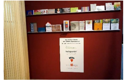
Flyerwand mit der Möglichkeit für Mitglieder Eigenwerbung zu machen

Ganz besonders stolz sind wir auf das Booklet "Erfahrungsberichte".